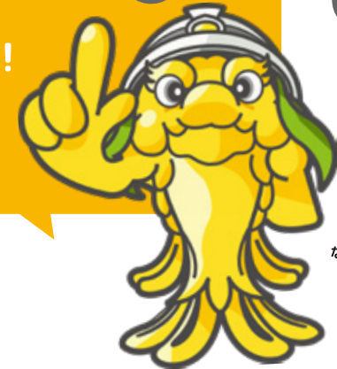
なごやししょうぼうきよく 名古屋市消防局 マスコットキャラクター 「ケッシー」